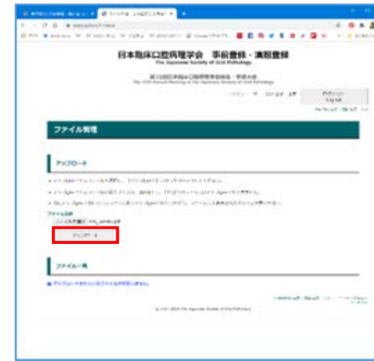
⑦選択したファイルが間違いなことを確認し、「アップロード」をクリック