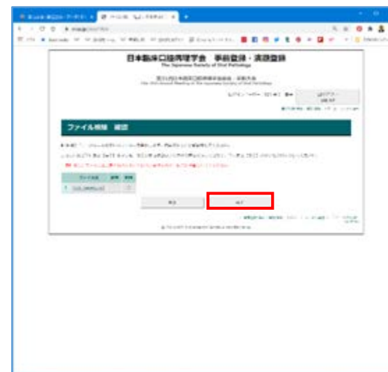
⑦削除するファイルが間違いないことを確認し、「完了」をクリック