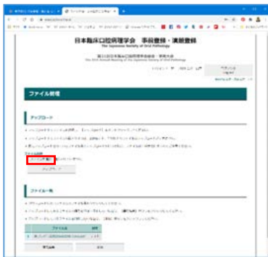
⑤「ファイルを選択」をクリック