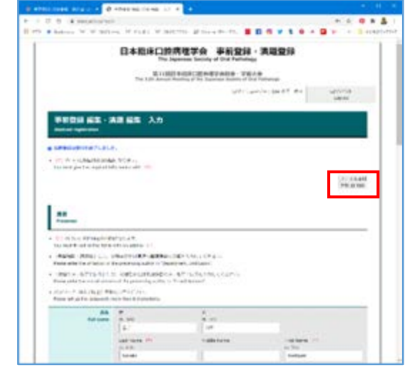
④「ファイル添付」をクリック