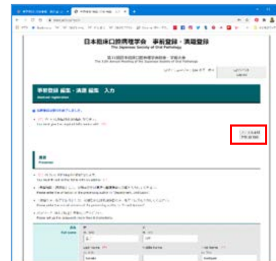
④「ファイル添付」をクリック