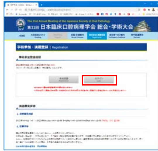
②「ログイン」をクリック