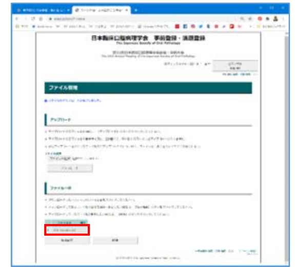
⑧「ファイルのアップロードが完了しました」という表示が出ますので、ファイル名を確認して完了