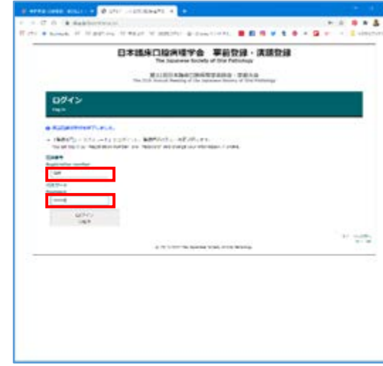
③登録番号とパスワードを入力