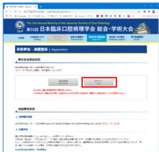
②「ログイン」をクリック