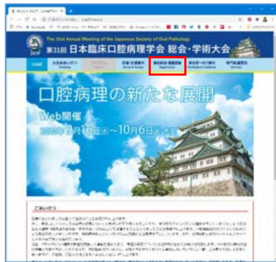
①「事前参加・演題登録」をクリック