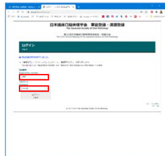
③登録番号とパスワードを入力