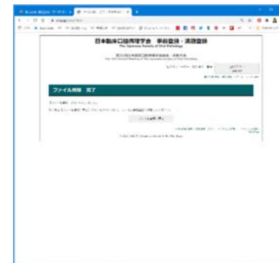
⑧「『ファイル削除』が完了いたしました」という表示を確認して完了 PDF1枚目の手順で、再度アップロードをお願いします